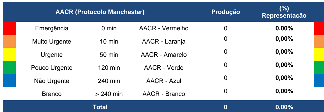
Tabela 7 - Acolhimento, Avaliação e Classificação de Risco – 16 a 31 de dezembro de 2021

Fonte: Relatórios MVSoul, Censo Urgência/Emergência, 2021.